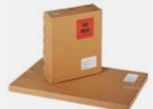
Versand als kit Shipped as an assembly kit