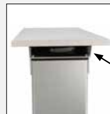
Kabelfach Cable bay