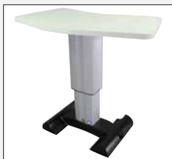
ak 103 v