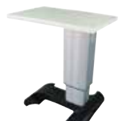
ak 103 a

Verschiedene Tischplatten und Gussfüße Various table tops and aluminum cast bases