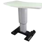
ak 103 v