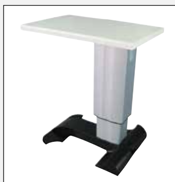
ak 103 a