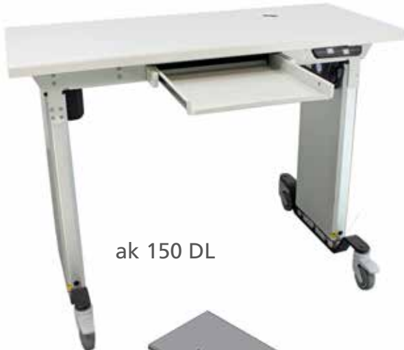
ak 150 DL