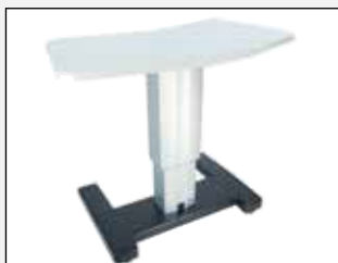
V Form Tischplatte V shaped table top