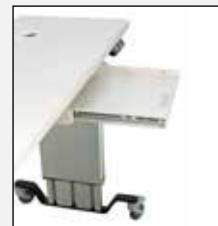
Option Tastaturauszug Option, key board drawer