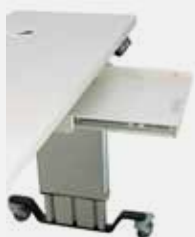
Optionaler Tastatúrauszug Optional key board drawer