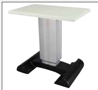
ak 103 s