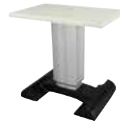
ak 103 s