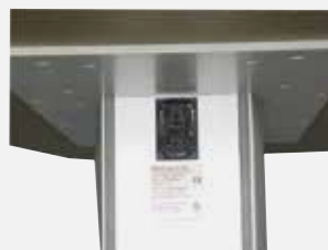
IEC Steckdose integriert Integrated IEC power outlet