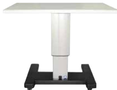
ak 130 HD